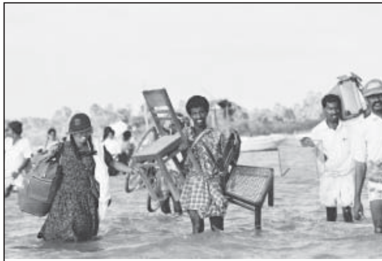
Tamilische Flüchtlinge mit ihrem letzten Hab und Gut auf der mühsamen Flucht

nun genau diese chauvinistischen Tendenzen. Auch die Schritte, die die Präsidentin unternommen hat, verbreiterten