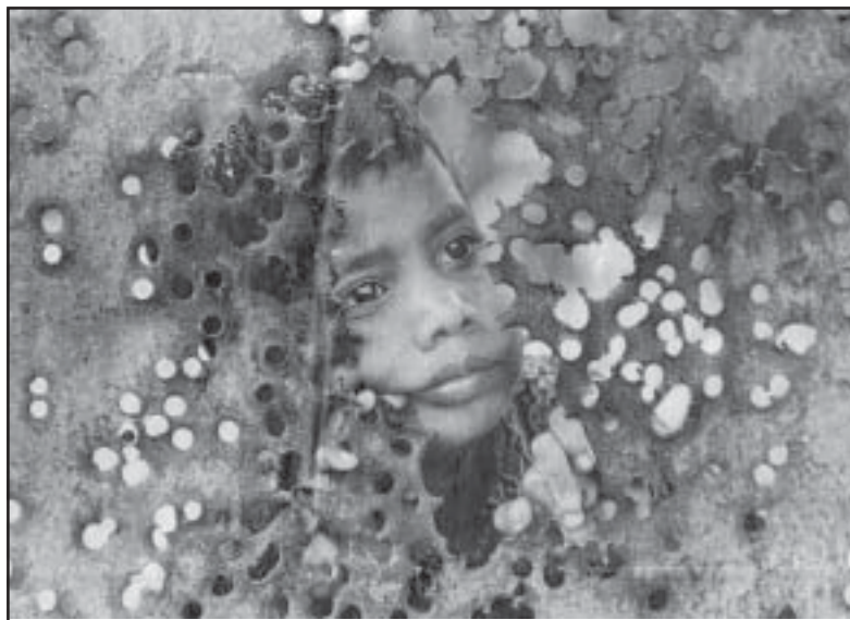
Ein tamilischer Junge schaut durch eine zerschossene Metallwand

entschieden hat, "die Gelegenheit zu verpassen, die tamilische Bevölkerung zu repräsentieren". Vielmehr wurde ihr diese Möglichkeit mit Gewalt entzogen, weil die LTTE daran gehindert wurde, an dem Vortreffen der Hilfskonferenz in Washington teilzunehmen. (Siehe Brief der LTTE- S. 2)