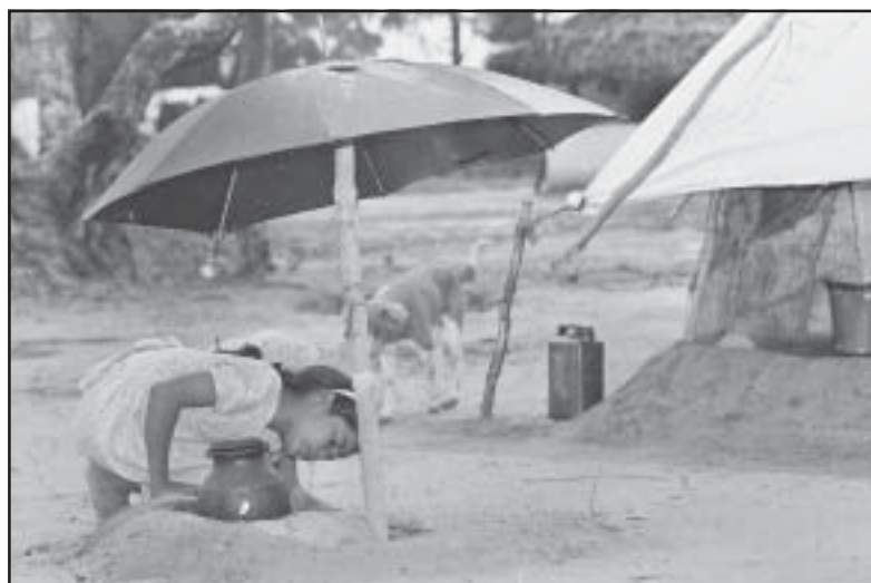
Ein tamilisches Mädchen in ihrer "Küche" in einem Flüchtlingslager

Statt auf Flüchtlinge als unerwünschte Personen zu schauen, die bei der erst besten Gelegenheit abgeschoben werden, wird diese Art Partnerschaft zeigen, dass wir wirkliche "Friedenspartner" sind, Partner für den Aufbau eines dauerhaften Friedens. Wenn unsere Projekte erfolgreich sind und alle vertriebenen Menschen, die verzweifelt darauf warten in ihr Häuser zurückkehren zu können, nach Hause können, dann würden wir auch gerne in unsere Länder zurückgehen, nicht gezwungenermaßen durch gewaltsame Abschiebung, sondern freiwillig. Der 1.Mai bringt die internationale Solidarität der Arbeiter aller Länder zum Ausdruck. Es ist eine Einheit von unten, die am 1.Mai ausgedrückt wird. Was wir vorschlagen, ist ein praktischer Schritt zur Einheit von unten. Ein praktischer Schritt, wo nicht Profit die Triebkraft ist, sondern menschliche Solidarität.