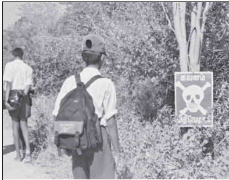
Tamilische Schulkinder passieren ein Minenfeld

Der Internationale Gemeinschaft sind diese Vorgänge bewusst. Wie können wir auch davon ausgehen, dass es ihnen nicht bewusst ist. Sie haben Sri Lanka schließlich für viele Jahre finanziell unterstützt, und ich bin sicher, dass sie die fehlende Entwicklung des Landes realisieren. In diesem Zusammenhang fällt es mir schwer zu verstehen, warum sie ein